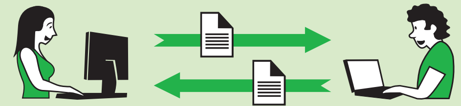
FORMATOS ABIERTOS, DISTINTO SOFTWARE

Elige formatos abiertos si quieres que otras personas puedan abrir tus documentos fácilmente sin tener que preocuparte por el programa que usan.