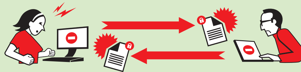
FORMATO CERRADO, DISTINTO SOFTWARE

Alicia usa el procesador de textos "Carcera (1) ". Guarda su informe en un formato cerrado (que no permite la interoperabilidad) y se lo envía a Roberto, que tiene el mismo programa. Roberto puede leerlo, modificarlo y enviárselo de vuelta a Alicia.